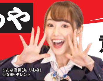
りおな店長(丸 りおな) ※女優・タレント